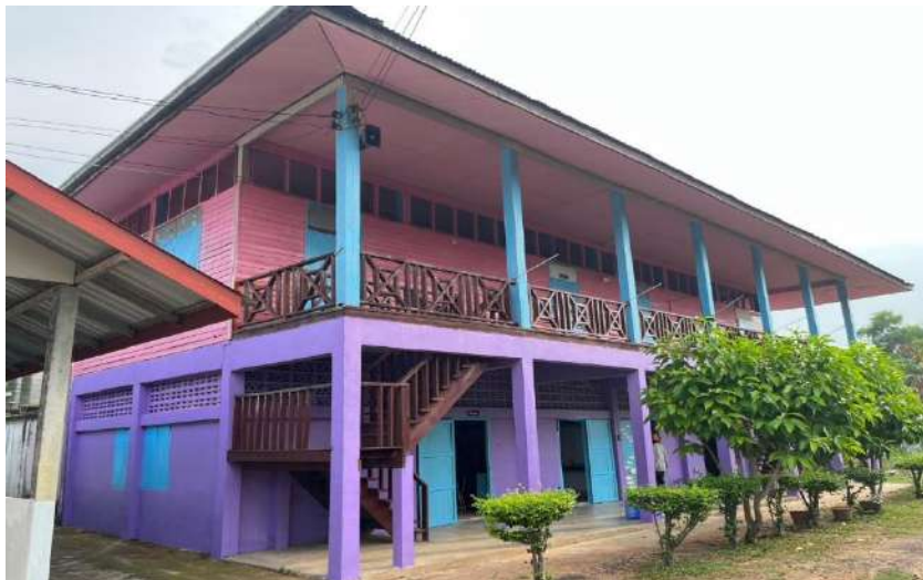
อาคารเรียน สปช.105/29 จำนวน 4 ห้องเรียน