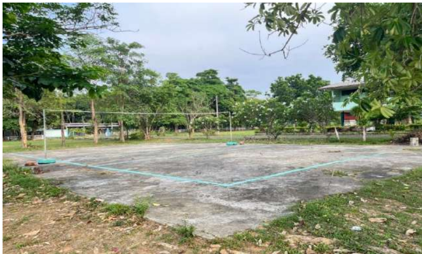
สนามตะกร้อ