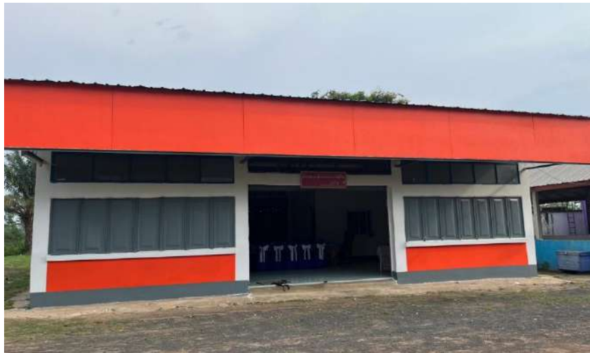
อาคารอเนกประสงค์ (โรงอาหาร)